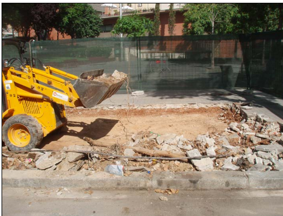
Figura 6 .- Vista de la màquina netejant

Primerament es va dur a terme l'aixecament de la pavimentació actual del carrer formada per llosetes de 20 x 20 cm lligades amb ciment (U.E. 01) i que presentaven un gruix de 5 cm. Aquest nivell de circulació cobria a una plataforma de formigó d'entre 10 i 15 cm de potència (U.E. 02), la qual corresponia a la capa de preparació de la pavimentació.