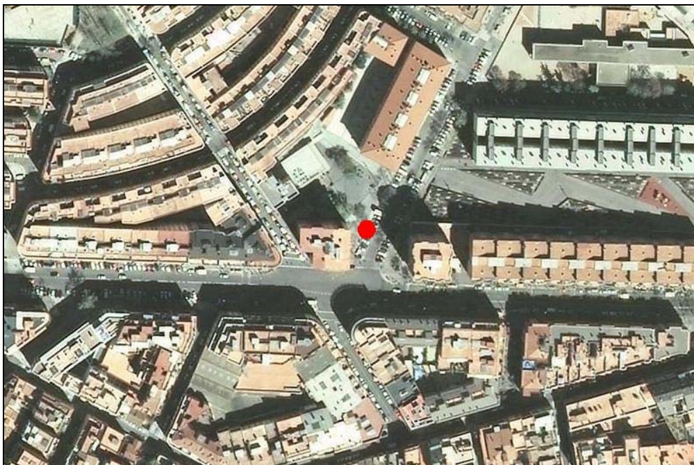
Figura 1. Ubicació més detallada de la obra dins el plànol topogràfic del districte de Nou Barris