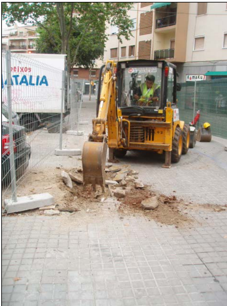
Figura 4 i 5. Inici tasques de rebaix.