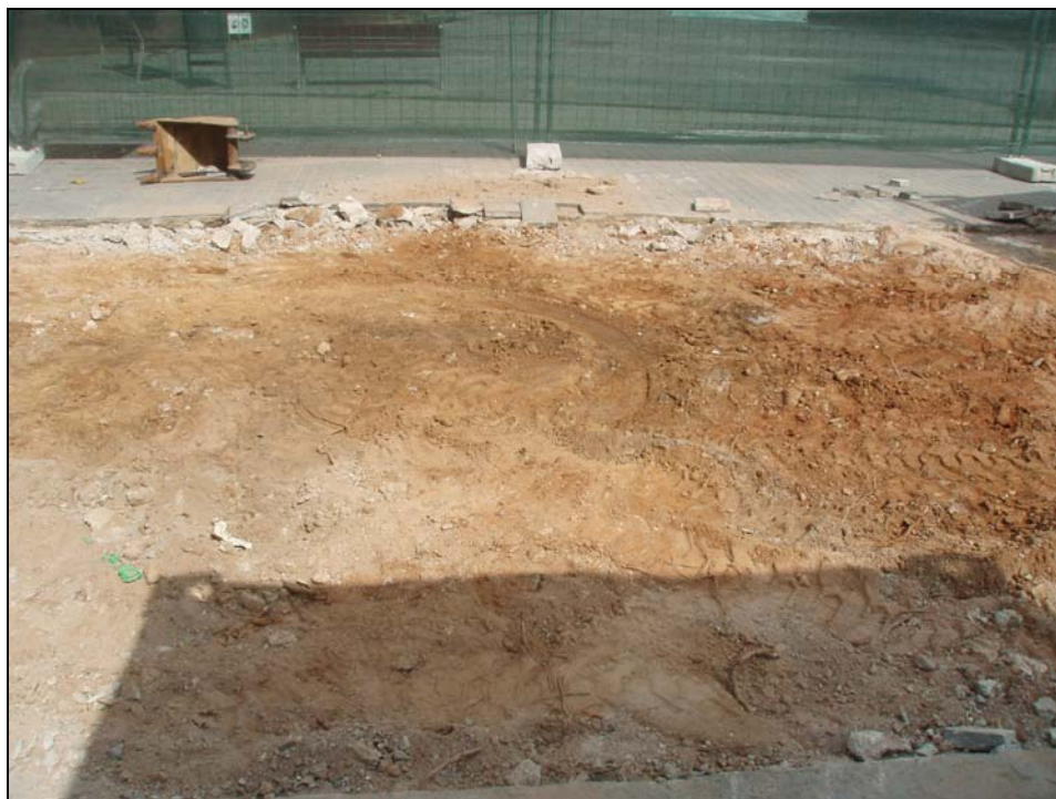
Figura 7. Foto parcial un cop extreta la U.e. 02.

En cap dels nivells excavat fou possible recuperar material arqueològic, degut a l'esterilitat dels mateixos. Les característiques geomorfològiques dels estrats excavats així com la profunditat assolida no han permetre localitzar nivell i estructures arqueològiques.